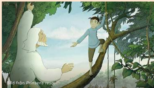
Bild från Prinsens resa .