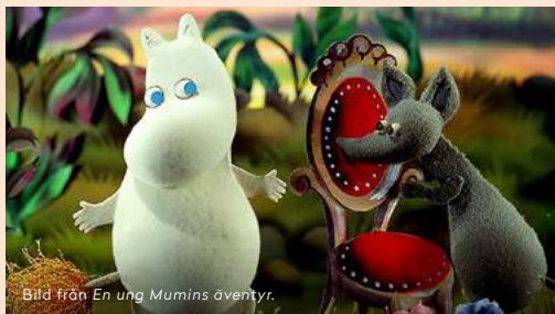
Bild från En ung Muminns äventyr .