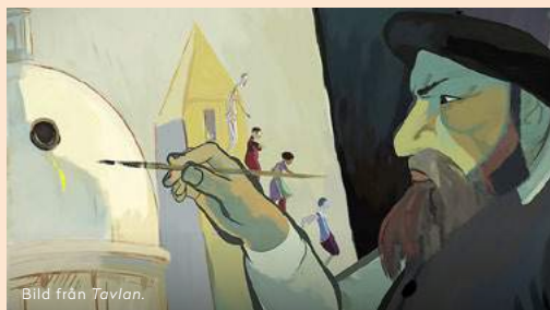
Bild från Tavlan .

Italien 2015. 1 timme 40 min. Från 11 år.