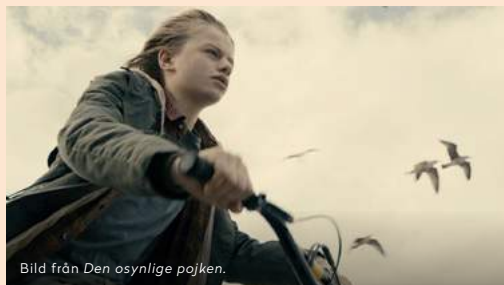
Bild från Den osynlige pojken .

Kanada, Frankrike 2016. 1 timme 30 min. Från 7 år.