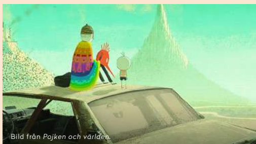
Bild från Pojken och världen .

Japan, 2015. 1 timme 59 min. Från 11 år.