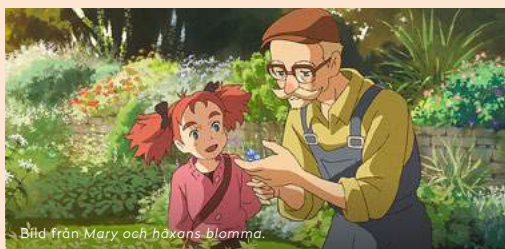
Bild från Mary och häxans blomma .